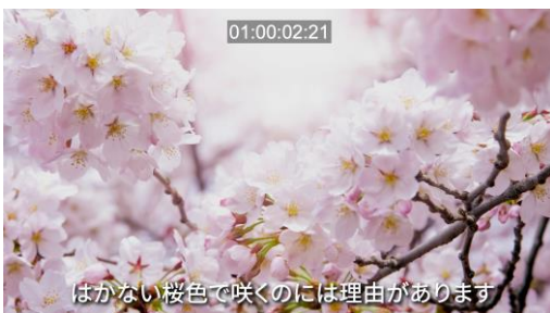
タイムコード入りの仮ミックス

③タイムコード入りの仮ミックスの動画と見直しリストを作成します。 それにお客様に校正・確認して頂き修正をして完成を納品します。